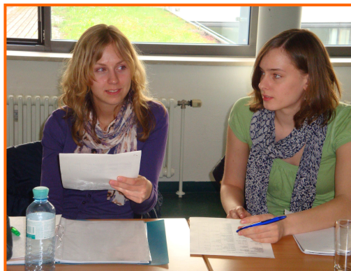
Mitglieder der Bundesjury bei der Arbeit

Der Prix des lycéens autrichiens ist ein Literaturpreis für österreichische Schüler mit 4 Jahren Französisch. Die teilnehmenden Schüler lesen 4 Werke französischsprachiger Jugendliteratur auf Französisch. Nach den Jurysitzungen vergeben sie einen Preis an den Siegerautor.