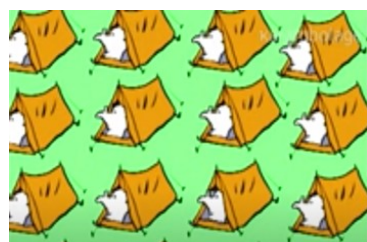
Les Français adorent le camping.