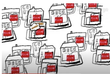
La plupart des magasins sont fermés.